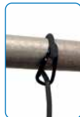
Eingebautes Trageband mit starkem Magneten und Haken zum Aufhängen