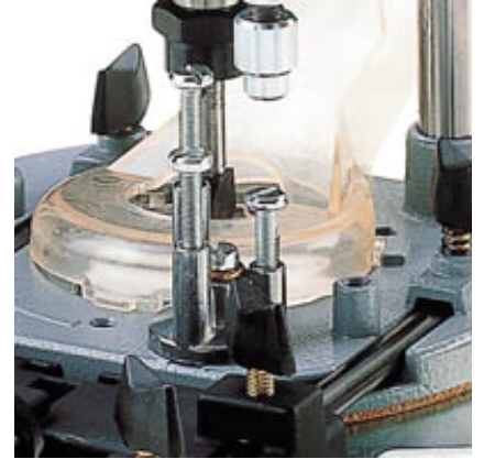
Schnelle Frästiefeneinstellung mittels stufenlos einstellbarem 3-fach Revolveranschlag.