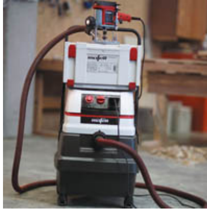
Eine saubere Sache! Die LO 50 E und der S 50 M von MAFELL.