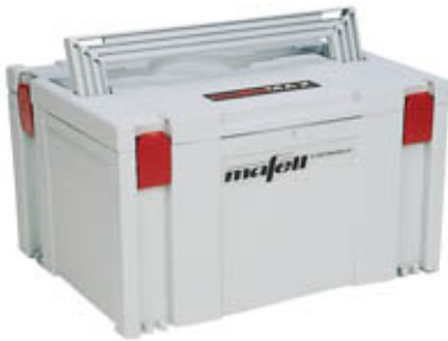
Die LO 50 E wird im praktischen MAFELL-MAX geliefert.