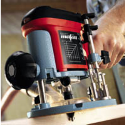
Profilierungen mit dem Anlaufring-Fräser.