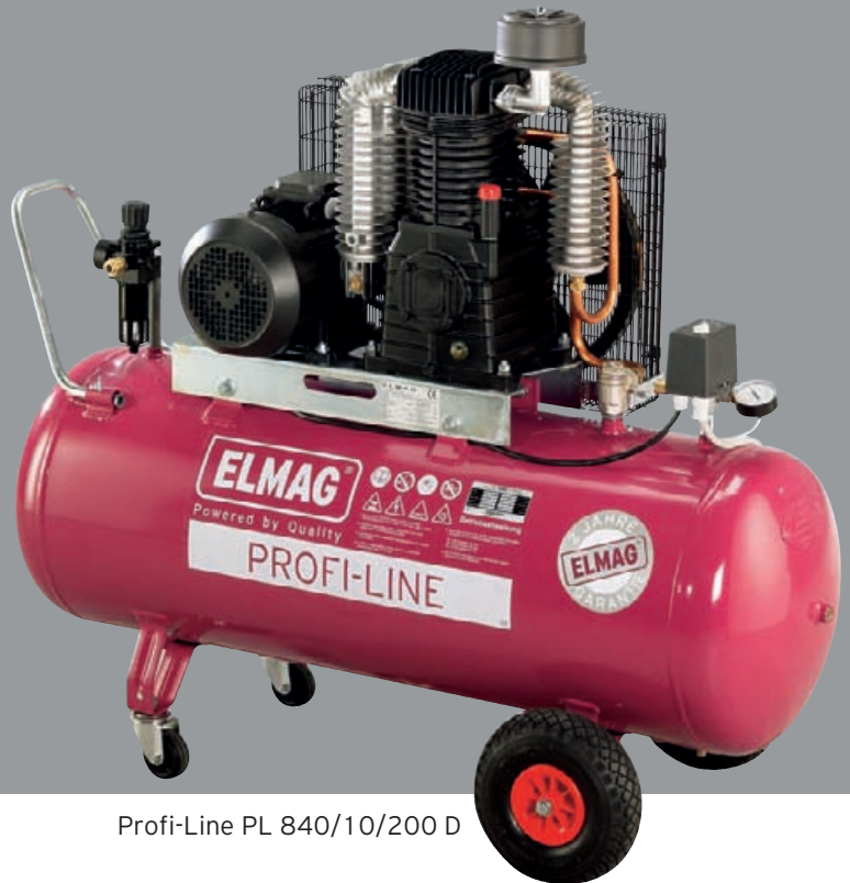
Profi-Line PL 840/10/200 D