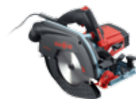
K 65 cc