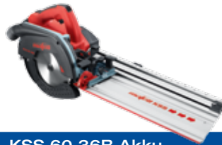
KSS 60 36B Akku