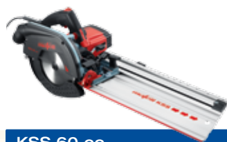
KSS 60 cc