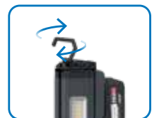
Haken zum Aufhängen