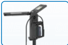
Verwenden Sie die Stromversorgung POWER SUPPLY für Direktanschluss.