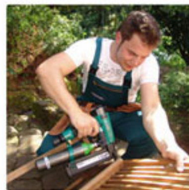
EAN-Code: 4016429 04634 1

Anwendungsgebiete: Zierleisten, Fußbodenleisten, Hohlkehlleisten, Glasleisten und vieles mehr