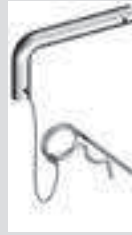
Geländer-Sicherung für Nr. 1330 aus Stahl. Zum Sichern der Doppel-Geländer mit der Geländer- befestigung. Gew. 0,1 kg.