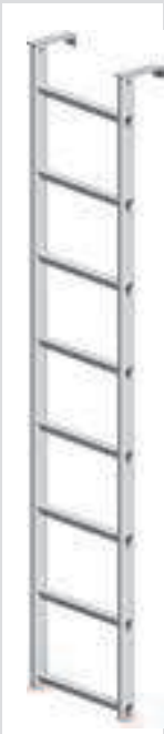
Einhängelleiter 8 Sprossen aus Aluminium. Länge 2,2 m, Gew. 5,8 kg. Art.-Nr. 1314.008