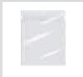
Sichttasche für 6344.200 und 6344.300.