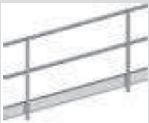
Doppel-Geländer 2,0 m mit Bordbrett aus Aluminium. Zum Transport zusammenfaltbar. Höhe 1,1 m, Gew. 9,7 kg.