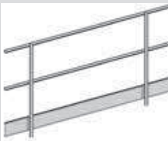
Doppel-Geländer 3,0 m mit Bordbrett aus Aluminium. Zum Transport zusammenfaltbar. Höhe 1,1 m, Gew. 12,9 kg.