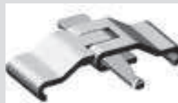
Klammer aus Stahl. Zum Verbinden der Alu-Stege Nr. 1348. Gew. 0,4 kg.