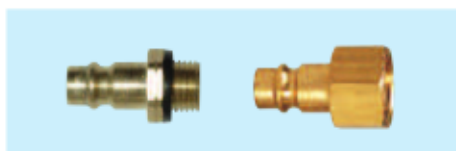
Stecknippel Connector, male thread