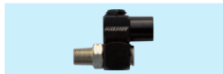
360° Druckluft-Drehgelenk 360° swivel air inlet