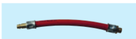
Anschlußschlauch, 20 cm, 1/4" AG / Stecknippel Flexible connection, 20 cm 1/4" male / plug nipple