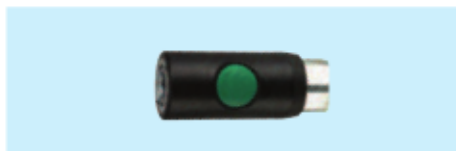
Sicherheitskupplung, IG Safety coupling, female thread