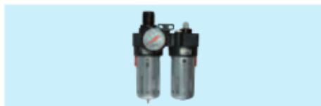
Druckluftwartungseinheit Air lubrication unit