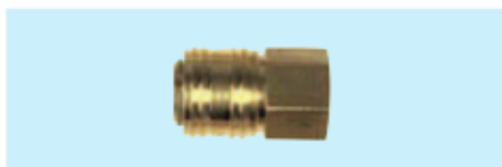
Schnellverschluß-Kupplungen, IG Quick release couplers, female thread