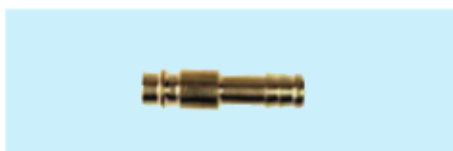
Stecktüllen Putting sleeves