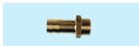
Gewindetüllen Thread sleeves