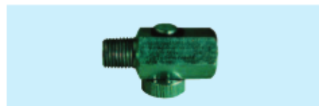
Druck-Reduzierventil, R 1/4" Air regulator, R 1/4"