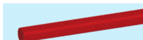
Druckluftschlauch, max. 15 bar / 20°C Air hose, max. 15 bar / 20°C