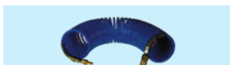
Spiralschlauch, inkl. Schnellverschlußkupplung Air coil hose