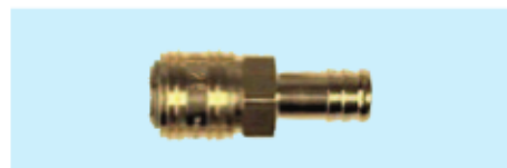
Schnellverschluß-Kupplungen, Tülle Quick release couplers, sleeves