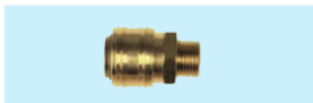
Schnellverschluß-Kupplungen, AG Quick release couplers, male thread